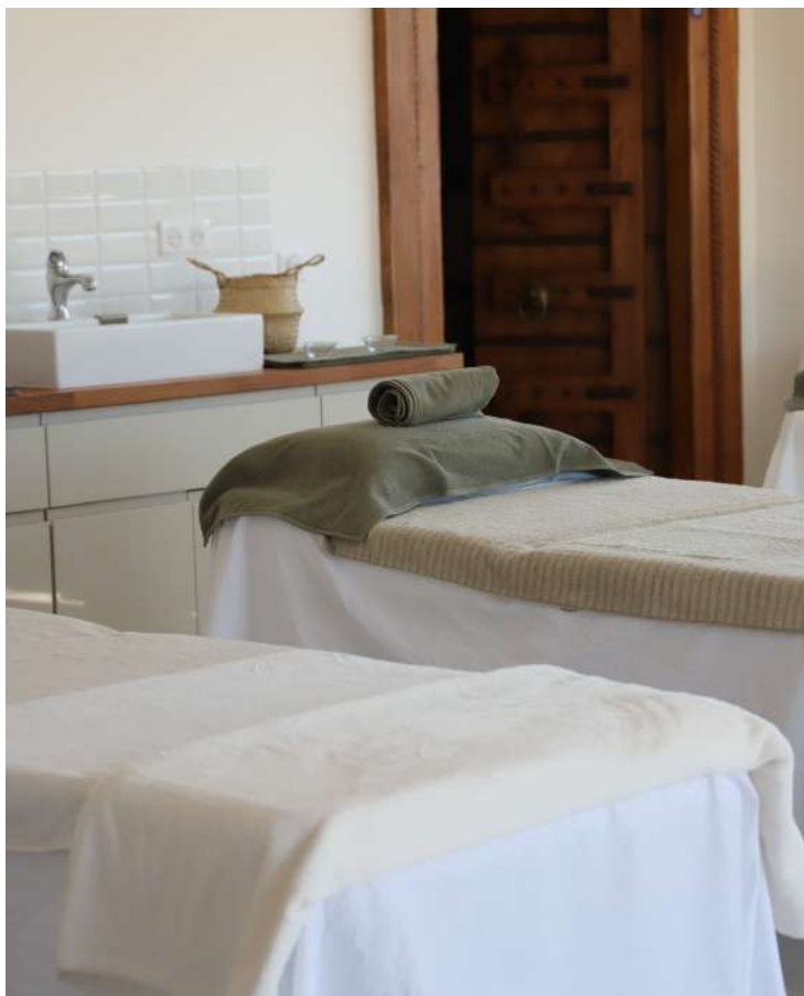
VÉGÉTALEMENT PROVENCE - SIÈGE 363, chemin Monplaisir 13 210 Saint-Rémy-de-Provence