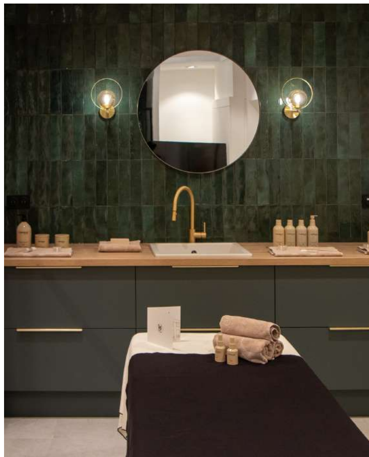
VÉGÉTALEMENT PROVENCE - FLAGSHIP 59, rue Beaubourg 75 003 Paris